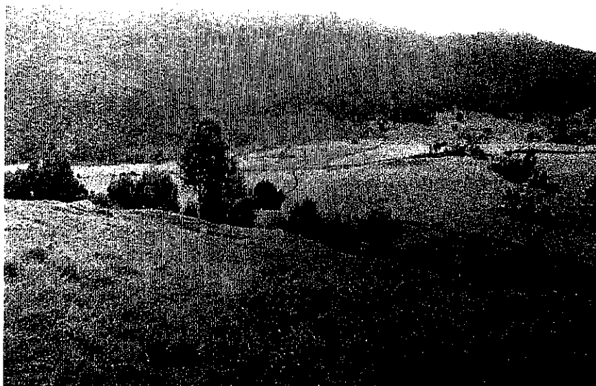
Imagen 1. Panorámica general del predio La Coruña, a registrarse como RNSC NUKUMA.

Según el informe técnico No. 114 de 2012 elaborado por la CAR, en cuanto a la relación del predio con el Sistema Regional de Áreas Protegidas – SIRAP, se tiene que: “...El predio limita por el costado noroccidental con un área protegida declarada por la Corporación y denominada Distrito de Manejo Integrado (DMI) Páramo de Guargua y Laguna Verde (Acuerdo CAR No. 022 de 2009); y se encuentra en su totalidad haciendo parte de la RFPP Cuenca Alta del Río Bogotá, la cual fue declarada por el INDERENA mediante Acuerdo 30 de 1976, aprobado por Resolución Ejecutiva 76 de 1977 del Ministerio de Agricultura, no cuenta con zonificación, y en la actualidad está en proceso de realinderación (Resolución MADS 511 de 2012)...”