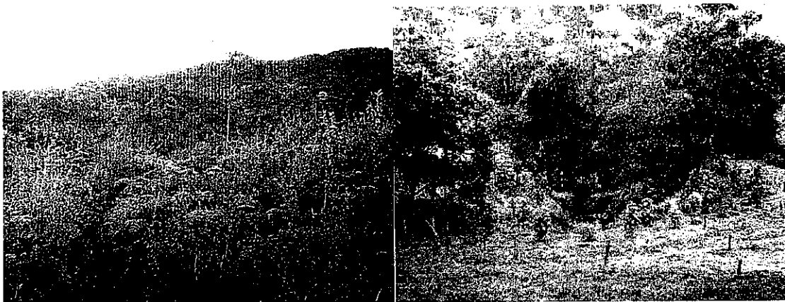
Imagen 2. Bosque nativo en la parte montañosa del predio (izquierda) y en la zona de ronda protectora del Río Frío (derecha) en el predio La Coruña, a registrarse como RNSC NUKUMA. Tomada del Informe Técnico No. 114 de 2012 elaborado por la Corporación Autónoma Regional de Cundinamarca-CAR.

3.2. Fauna: De acuerdo con la información suministrada por el dueño del predio, en este se observan aves como Turdus fuscater (Mirla), Zonotrichia capensis (Copetón), Piculus rivolii (Carpintero), Colibríes, entre otros; mamíferos como Dasybus sp. (Armadillo), Didelphis sp. (Fara o Chucha).